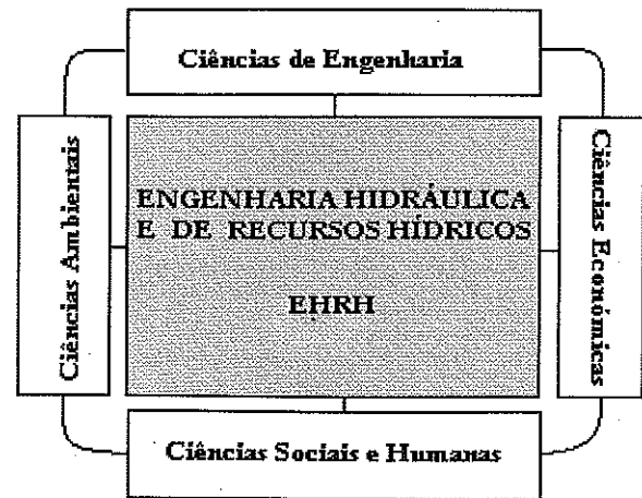
Figura 3-Representação do âmbito da Engenharia Hidráulica e dos Recursos Hídricos.

Uma alteração pretensamente simples, na biosfera, pode desencadear um conjunto de alterações sucessivas de consequências muitas vezes imprevisíveis e irreversíveis, tanto em termos sociais como ambientais. Se adicionarmos aos efeitos directos dum empreendimento de engenharia, por exemplo a construção duma barragem, as externalidades geralmente associadas (e.g., fixação de indústrias, complexos de urbanização, práticas recreativas, entre outras), o problema torna-se, obviamente, muito mais complexo. É este conceito de interdependência e interconexão entre os vários factores ( vide Figura 2 e Figura 3) que urge introduzir no ensino da EHRH e em todas as engenharias que intervem no espaço natural.